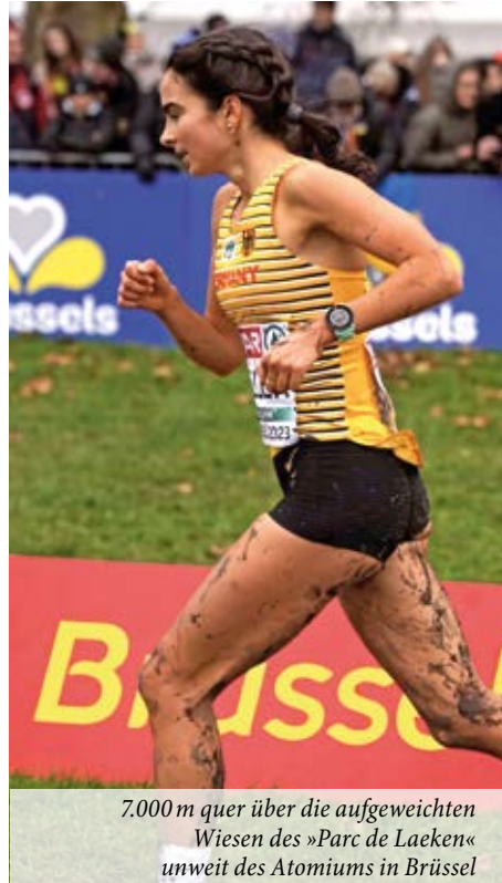
7.000 m quer über die aufgeweichten Wiesen des »Parc de Laeken« unweit des Atomiums in Brüssel

„Das war ein richtig tolles Gefühl mit Athletinnen aus so vielen Ländern an den Start zu gehen. Allein schon im Athletenhotel, dem Callroom oder im Athletenzelt war die Atmosphäre ganz besonders. Ich bin überglücklich, dass ich so was mal erleben durfte“, resümiert die frischgebackene Vize-Team-Europameisterin. Denn es kam noch besser: